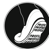
Fig. 8: signal de sécurité «Porter des chaussures à semelles profilées» (réf. Suva 1729/63).