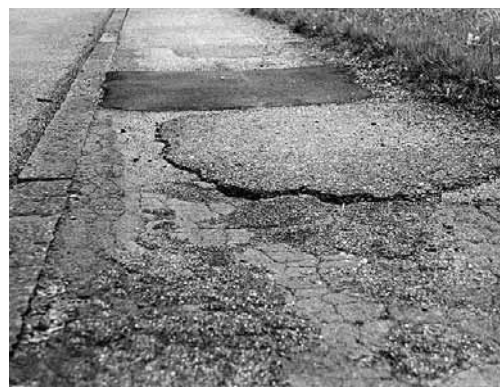
Fig. 3: revêtement mal réparé. Les différences de niveau doivent rester les plus faibles possible.