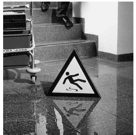
Fig. 7: il faut indiquer clairement ou délimiter les endroits glissants (par ex. après des travaux de nettoyage) et les endroits où l'on risque temporairement de trébucher (câbles, tuyaux, etc.).