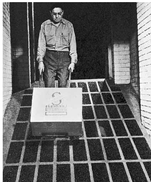
Fig. 1: rampe avec un revêtement antidérapant.