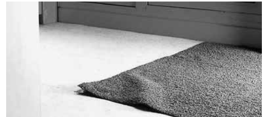
Fig. 5: les bords des tapis qui se relèvent peuvent être fixés, par ex. par des baguettes.