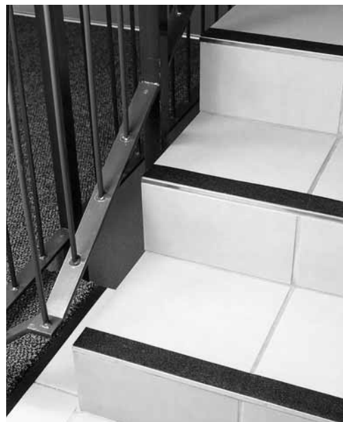
Fig. 2: bandes antidérapantes installées ultérieurement sur un escalier en pierre lisse.