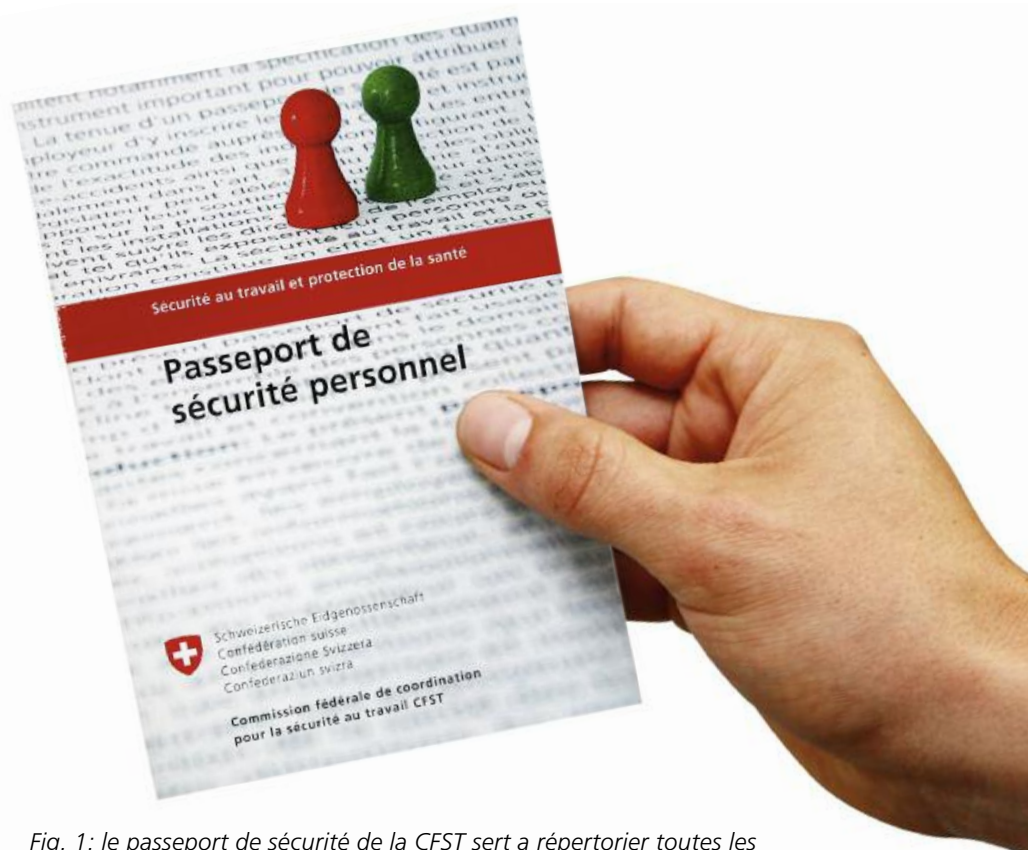
Fig. 1: le passeport de sécurité de la CFST sert à répertorier toutes les formations et instructions pertinentes suivies dans le domaine de la sécurité au travail et de la protection de la santé.

Le passeport de sécurité de la CFST sert à répertorier les instructions et les formations accomplies dans le domaine de la sécurité au travail (ST) et de la protection de la santé (PS) au poste de travail. Le passeport de sécurité personnel de la CFST offre un bref aperçu du niveau de préparation des travailleurs aux plans de la sécurité au travail et de la protection de la santé et permet de prendre les mesures nécessaires afin de réduire les risques d'accidents professionnels. En cours de mission, l'entreprise locataire de services demeure toutefois tenue de contrôler régulièrement la mise en œuvre des connaissances indiquées.